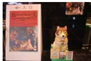
パトラッシュ基金ではルーベンス展等のイベントにて募金活動を実施しました。