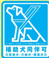
〈補助犬同伴可ステッカー〉

「補助犬同伴可ステッカー」についてのお問い合わせは 全国盲導犬施設連合会にお電話(03-5367-9770)、 もしくは当連合会ウェブサイトをご覧ください。