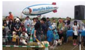
メットライフ アリコ様の「スヌーピー」号」飛行船一般公開にも参加しました。