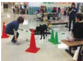
フジ様の店内にて盲導犬の実演を開催しました。