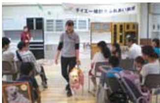
ダイエー様の補助犬ふれあい教室には、お客様だけではなく従業員の皆様にもご参加いただきました。

多くの皆様へ盲導犬について知ってもらうために全国各地へ出向き、盲導犬の仕事や訓練方法を紹介するイベントを実施しました。(主には募金箱設置店や寄附協力企業のご協力により開催)