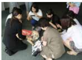
セブン&アイ・ホールディングス様では本社社員の皆様と盲導犬PR犬のふれあいを実施しました。