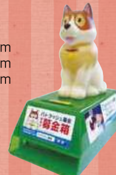
パトラッシュ募金箱