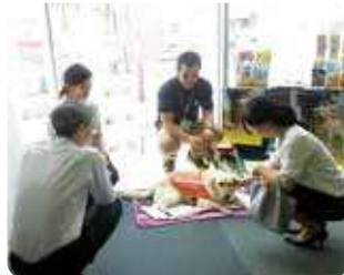
盲導犬ふれあい広場 (株式会社イトーヨーカ堂、株式会社セブン&アイ、 フードシステムズ、株式会社ヨークマート)