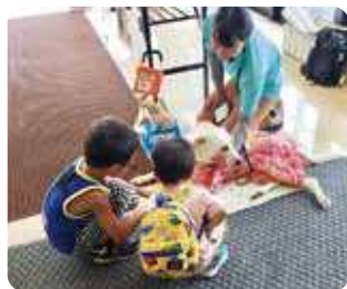
盲導犬ふれあい広場 (株式会社ヨークマート)