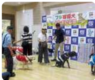
盲導犬ふれあい広場 (株式会社フジ)