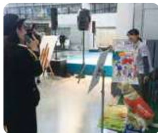
交通安全。アクション (日本自動車会議所)