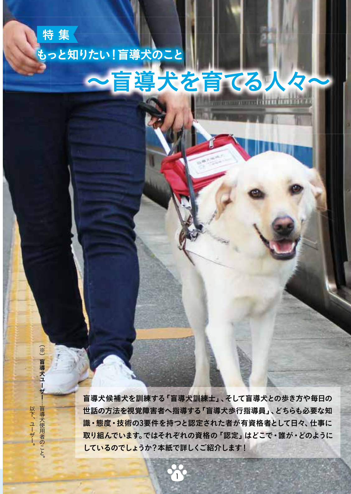
(※) 盲導犬ユーザー!...盲導犬使用者のこと。以下、ユーザー。

盲導犬候補犬を訓練する「盲導犬訓練士」、そして盲導犬との歩き方や毎日の世話の方法を視覚障害者へ指導する「盲導犬歩行指導員」、どちらも必要な知識・態度・技術の3要件を持つと認定された者が有資格者として日々、仕事に取り組んでいます。ではそれぞれの資格の「認定」はどこで・誰が・どのようにしているのでしょうか?本紙で詳しくご紹介します!