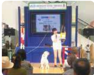
エコ博 (ユニー株式会社)