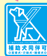
〈補助犬同伴可ステッカー〉