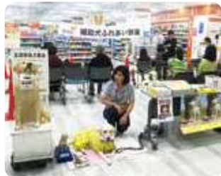
ダイエー補助犬ふれあい教室 (株式会社ダイエー)

多くの皆様へ盲導犬について知ってもらうために全国各地へ出向き、盲導犬の仕事や訓練方法を紹介するイベントを実施しました。(主には募金箱設置店や寄附協力企業のご協力により開催)