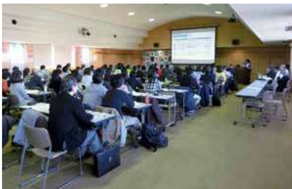
〈盲導犬育成ジャパンセミナー〉一堂に会して学びます。